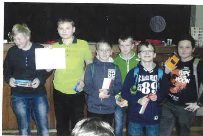
Úspěšné družstvo šachistů ZŠ Sobotka