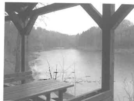
Pohled od občerstvení na hradě Kost

užil štípaný šindel. I nadále bude budova mlýnu sloužit jako nájemní domeček, tentokrát pro zaměstnance restaurace.