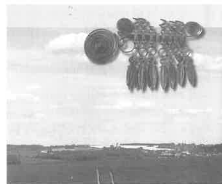
ARCHEOLOGIE KRAJE BÁSNÍKŮ Archeologie Sobotecka v Českém ráji