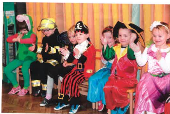
Karneval v MŠ Sobotka