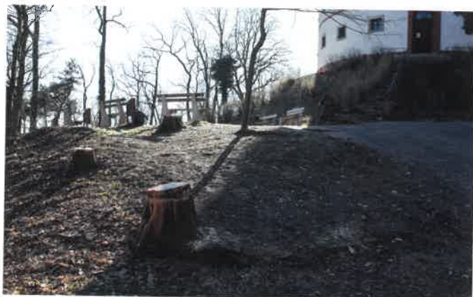
Kácení v Sobotce