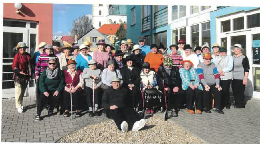
Vlastenecko dobročinná obec baráčníků a jejich „Klobouková party“