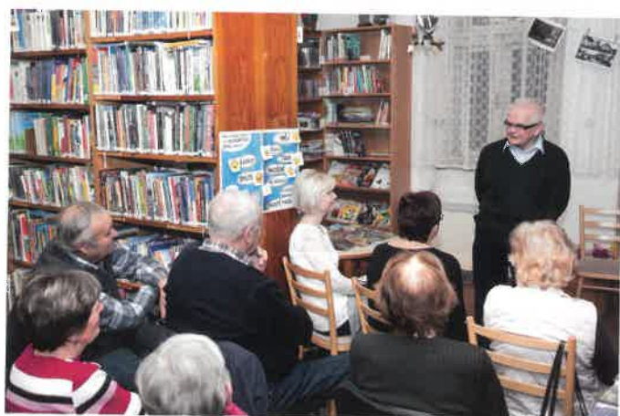
Beseda o zdravotnictví v Sobotce