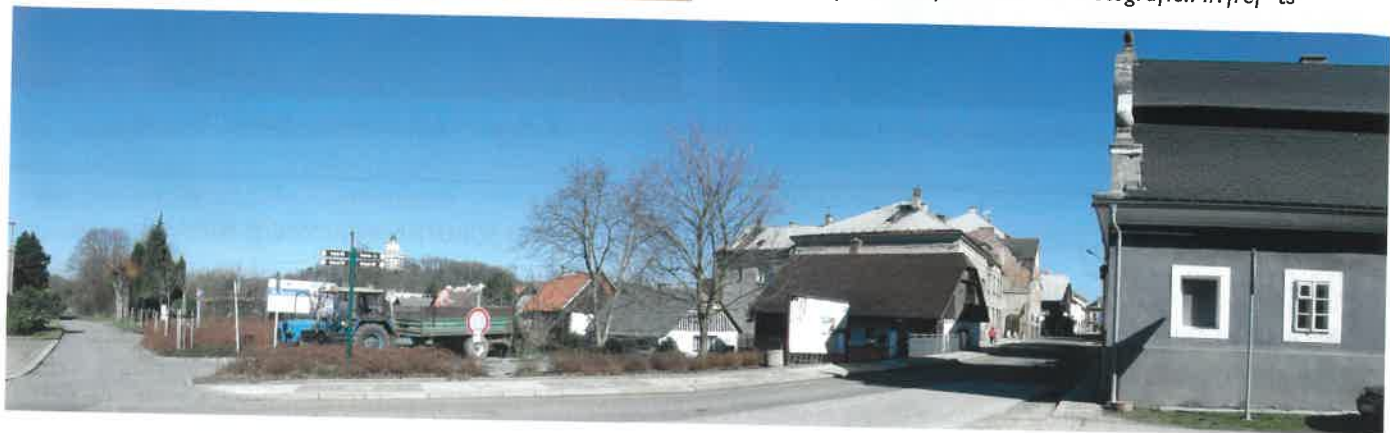
Panorama Sobotky – poznáte co chybí na fotografii?