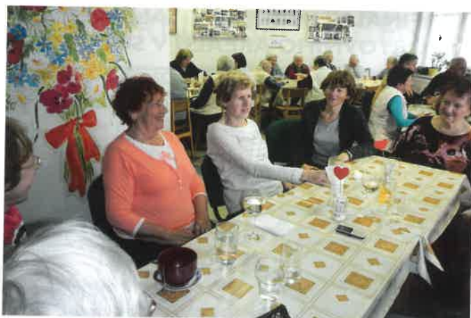
DPS Sobotka – oslava MDŽ