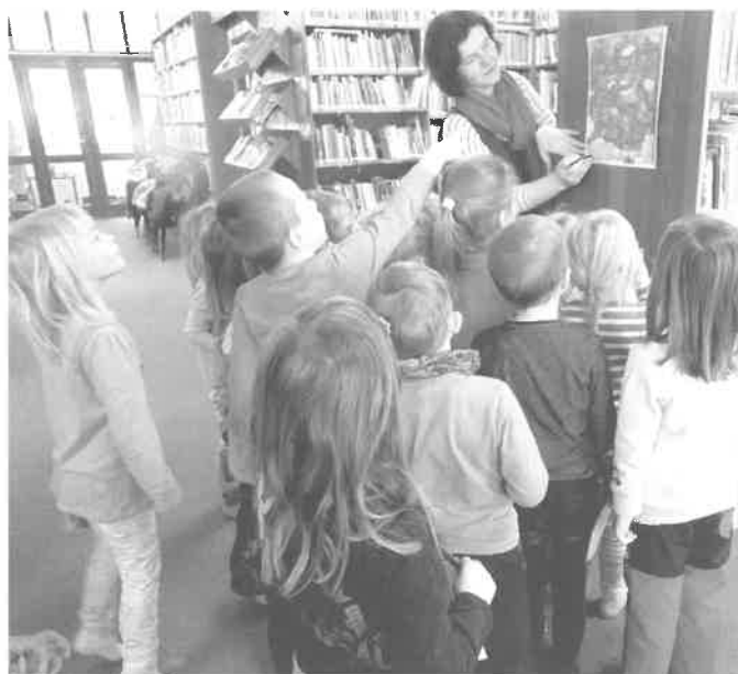
Knihovna F. Šrámka v Sobotce a nejmenší čtenáři