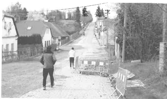
Rekonstrukce ulice Na Celné