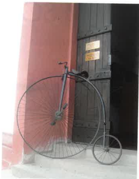
Kolo ze sbírek soboteckého muzea bylo patrně vyrobeno firmou Bayliss Thomas and Co., má značku Excelsior – foto: I. Jalovecká

Kulturní a společenské akce v Sobotce a okolí 26