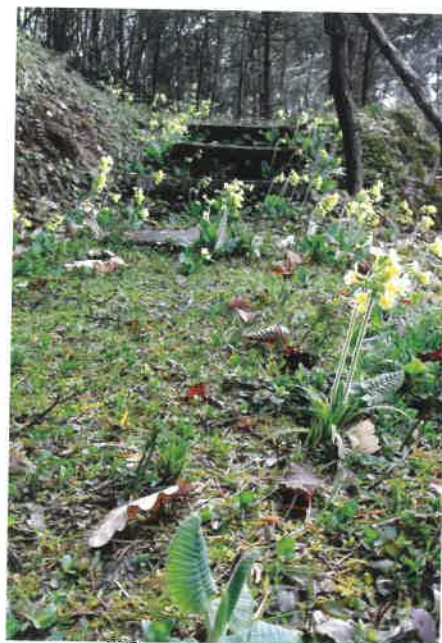
Jaro v Českém ráji